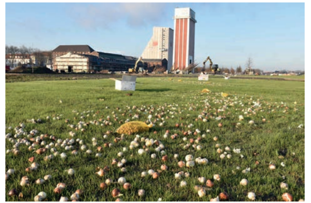
Die ausgelegten Blumenzwiebeln...