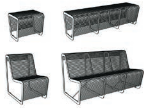
Die Möbelstücke der Limpido-Serie

do-Serie werden entlang der Promenade stehen. Die jeweiligen Möbeltypen bilden dann verschiedene Sitzgruppen. Interessierte können sich beim Grünflächenamt der Stadt Kamp-Lintfort (Email: gruenflaechenamt@kamp-lintfort.de) melden und eine Patenschaft beantragen. „Durch ein Namensschild an dem Baum oder der Bank wird der Spender sichtbar gemacht“, verspricht der Geschäftsführer.