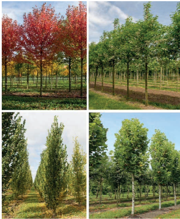
Links oben: Rotahorn rechts oben: Gewöhnliche Robinie links unten: Säulen-Ulme rechts unten: Platane