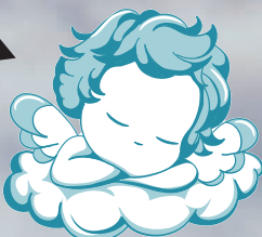
PHOTO PORST Friedrichstraße 13a 47475 Kamp-Lintfort Telefon (02842) 10031 www.porst-kali.de

Czaykowski KÜCHEN • HAUSGERÄTE • KUNDENDIENST Nordstraße 2 · 47475 Kamp-Lintfort Tel. 0 28 42 87 87 czaykowski@t-online.de www.czaykowski.de